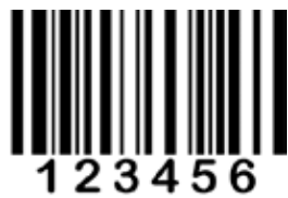
CÓDIGO DE BARRAS